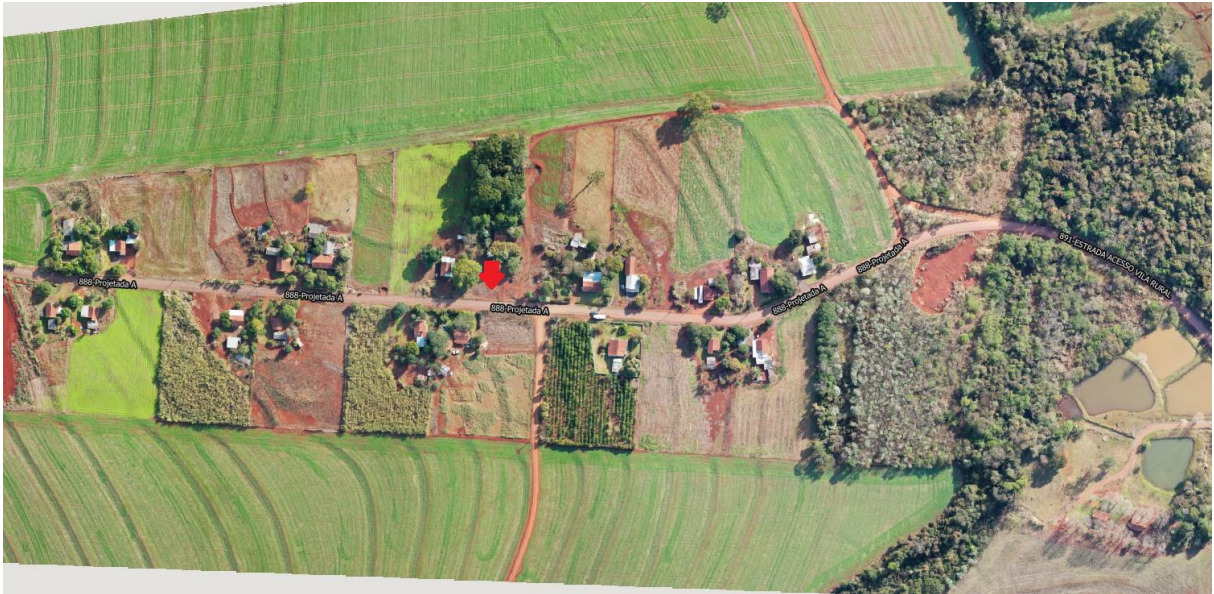
Imagem 02 – Localização para implantação de Academia ao Ar Livre na Vila Rural de Nova União.