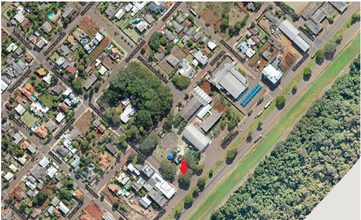
Imagem 01 – Localização para implantação de Parque Adaptado na Praça da Matriz.

A base de concreto armado referente ao Parque Adaptado será construída na Praça da Matriz, que pode ser acessada pela Avenida Nilo Bazzo conforme Imagem 01.