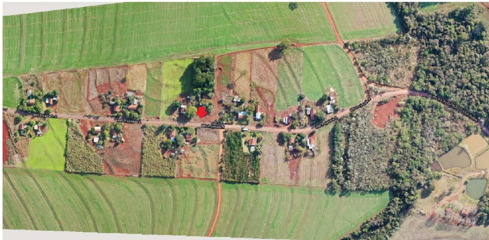
Imagem 02 – Localização para implantação de Academia ao Ar Livre na Vila Rural de Nova União.