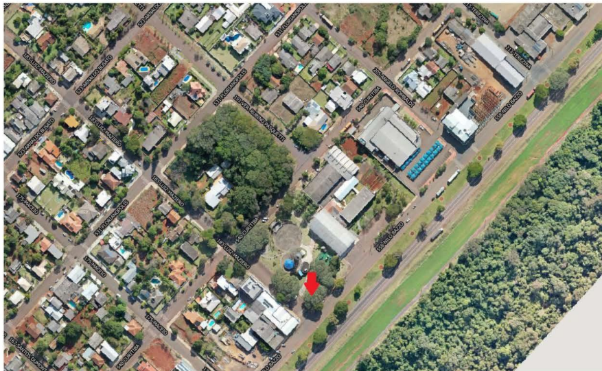
Imagem 01 – Localização para implantação de Parque Adaptado na Praça da Matriz.

A base de concreto armado referente ao Parque Adaptado será construída na Praça da Matriz, que pode ser acessada pela Avenida Nilo Bazzo conforme Imagem 01.